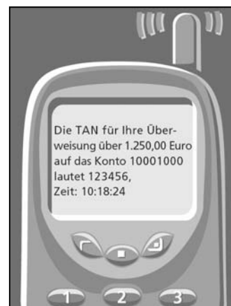
Beispiel: SMS für eine Überweisung